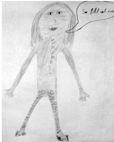
Neunjähriges Mädchen, starke psychosomatische Bauchschmerzen, mehrere Aufnahmen in der Notfallambulanz, 10-tägiger Klinikaufenthalt.

Die Frage: „Wo im Körper fühlen Sie sich am wenigsten angespannt?“ hat ihn in ungläubige Verwirrung gestürzt. „Wo? Nirgends. Es ist überall schlimm.“ „Ja, genau. Vielleicht finden wir Stellen, wo es sich anders anfühlt?“